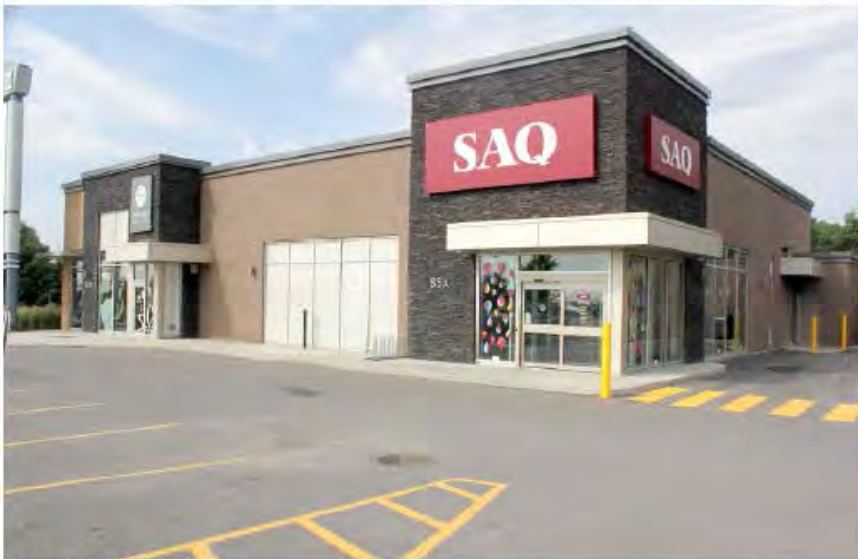
VUE DE LA SAQ