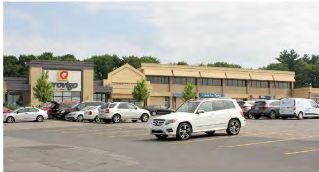
VUE DU PROVIGO